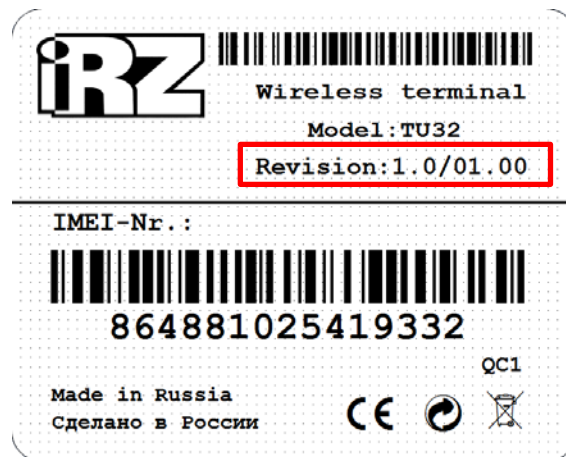
Рис. 1.1 TU32 – информационная наклейка

Данное руководство ориентировано на опытных пользователей ПК и содержит описание устройства и порядок эксплуатации 3G-модема iRZ TU32 (revision: 1.0-01.00). Сведения о ревизии модема содержатся на этикетке, расположенной с обратной стороны устройства (см. рис. 1.1).